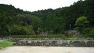
7 世界遺産 二条城 (京都府京都市)