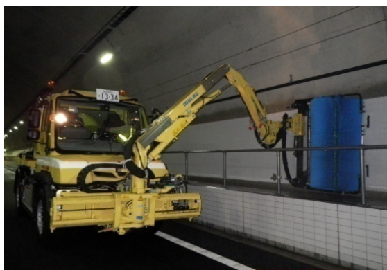
《トンネル側壁清掃》