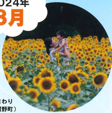
ひまわり (与謝野町)