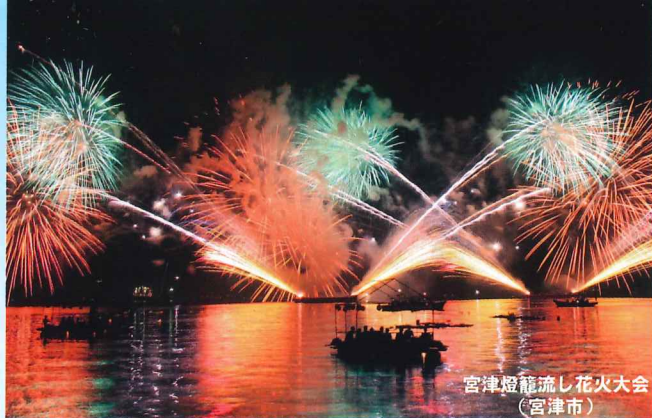
宮津燈籠流し花火大会 (宮津市)