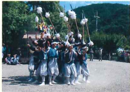
伊根町 本庄祭 検索