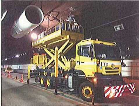
《トンネル設備清掃・点検》

消火設備、ジェットファン、照明設備等のトンネル附属物、排水構造物等の道路附属物を常時良好な状態に保つための点検・清掃を行います。