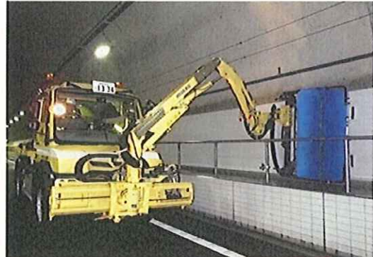
《トンネル側壁清掃》