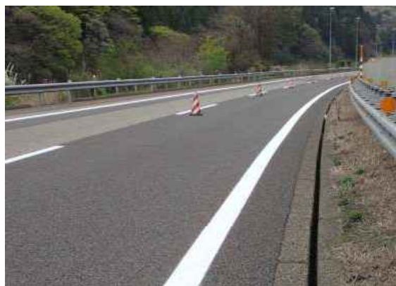
《路面標示工の施工》