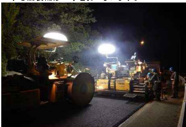
《路面損傷箇所の補修》

走行安全性・快適性の確保のため、舗装面のひび割れや段差などが顕著に発生している箇所を修復する舗装補修工事をおこないます。