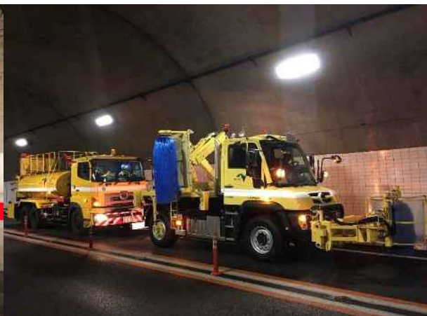
《トンネル側壁清掃》