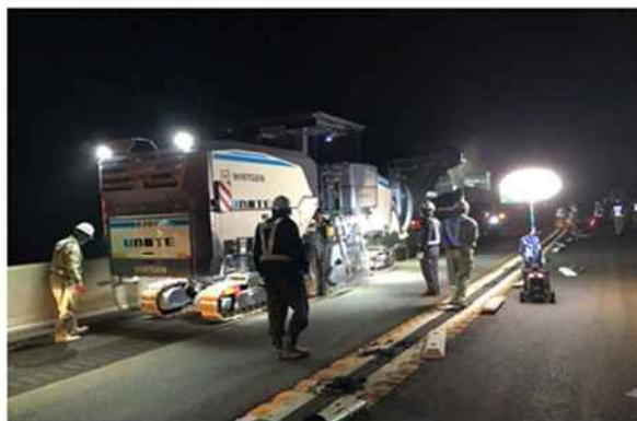
《傷んだ舗装撤去状況》

橋梁の床版※に雨水などが浸透すると床版の耐荷力や耐久性に悪影響を及ぼすため、浸透しないよう防水層を設けています。舗装損傷（ポットホールなど）に伴い防水層も損傷しているため、損傷した防水層の再施工をおこないます。