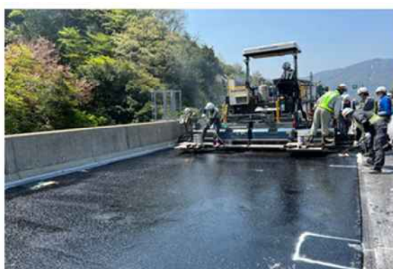
《床版防水工施工状況》