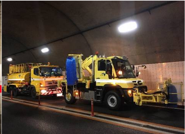
《トンネル側壁清掃(イメージ写真)》