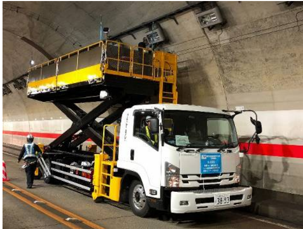
《設備清掃・点検(イメージ写真)》

消火設備、ジェットファン、照明設備などのトンネル附属物、排水構造物などの道路附属物を常時良好な状態に保つための点検・清掃をおこないます。