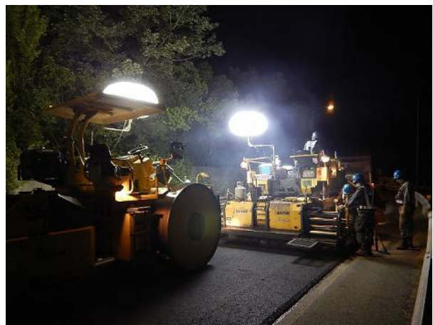
《舗装補修施工状況(イメージ写真)》