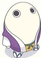
京都府広報監「まゆまる」