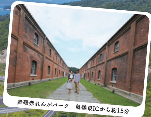
舞鶴赤れんがパーク 舞鶴東ICから約15分