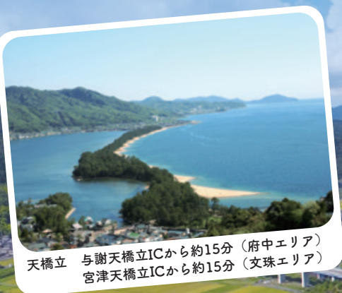
天橋立 与謝天橋立ICから約15分(府中エリア) 宮津天橋立ICから約15分(文珠エリア)