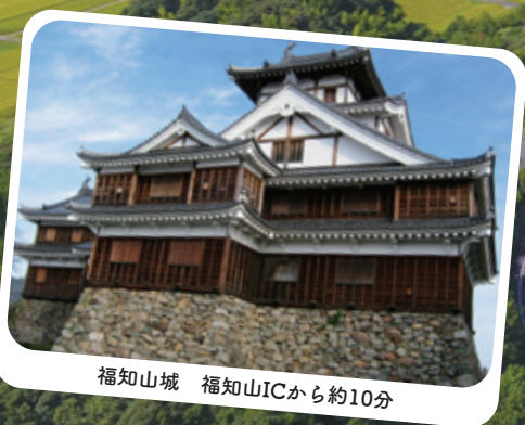
福知山城 福知山ICから約10分