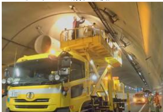
《ジェットファン清掃・点検》